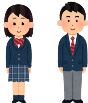
ぶれざー <ブレザー> すかーと <スカート>